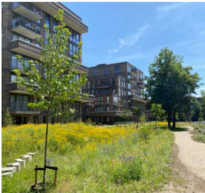
zicht parktuin op de heuvel en ontmoetingplek