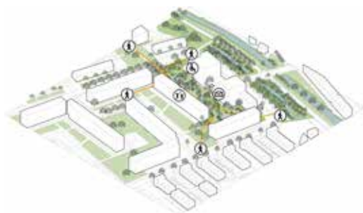
parktuin voor bewoners én de buurt