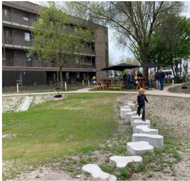
breed gedeelte wadi met stapstenen en uitstroompunt dakwater