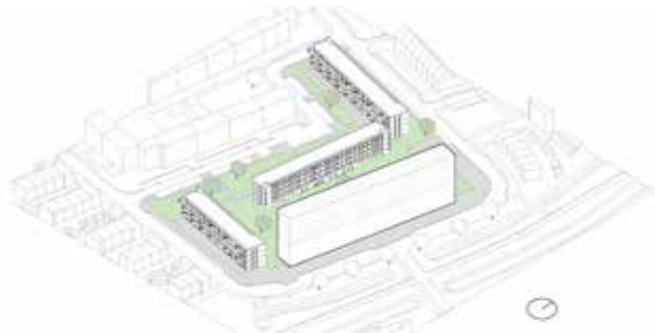
verdichtingsvraagstuk binnen de bestaande gebouw afmetingen van blok 4