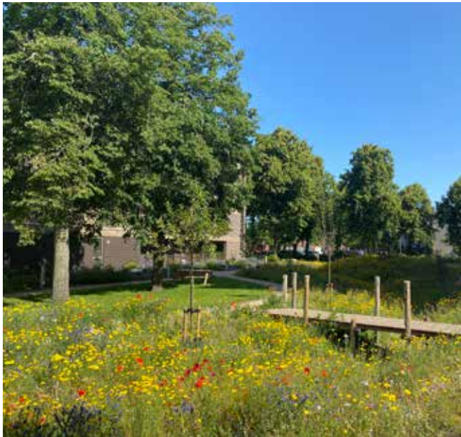
brug over de wadi naar picknickplek