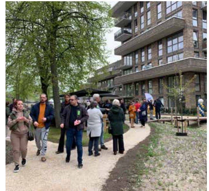
openingsfeest 16 april 2025