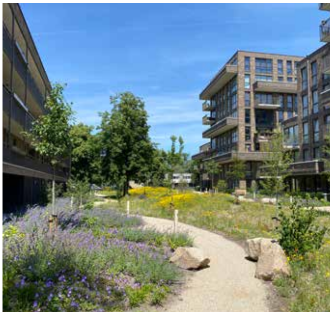
natuurlijke beplanting in middenzone en cultureel randen