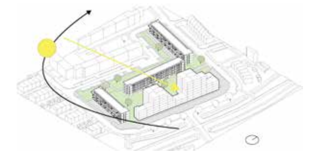
zuidelijk blok laten vertrappen voor minder schaduwwerking en geen spiegeling vanuit de as

verblijfsruimtes met een eigen identiteit – van collectieve tuinen tot informele ontmoetingsplekken – die de sociale cohesie versterken en het dagelijks gebruik stimuleren.