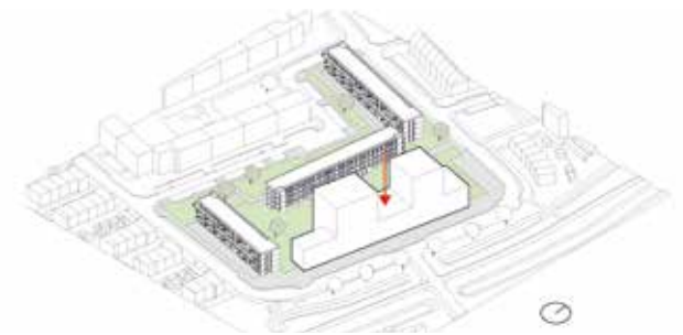
massa indrukken in het midden voor betere orientatie woningen en daglicht binnentuin