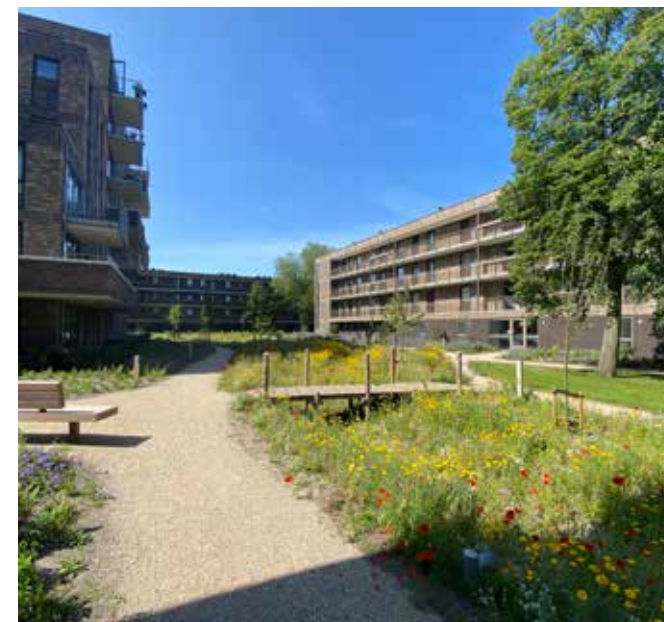
wandelpad, zitplek en bloemrijke wadi