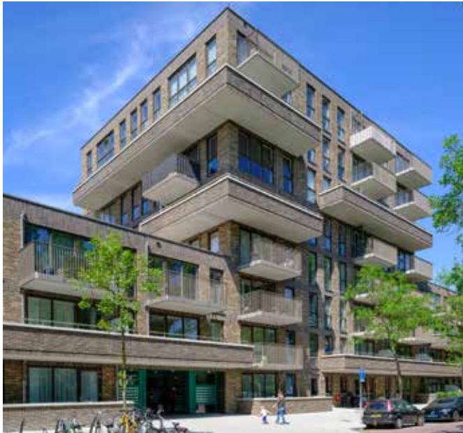
woningbouwblok 4 de Strokontoren De Bazellaan

Locatie Haarlem Oost Parkwijk, Dudokpark, Staalstraat, De Bazellaan en Berlagelaan