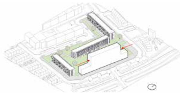
hoeken induwen voor aansluiting op de andere blokken en daglicht voor de binnentuin