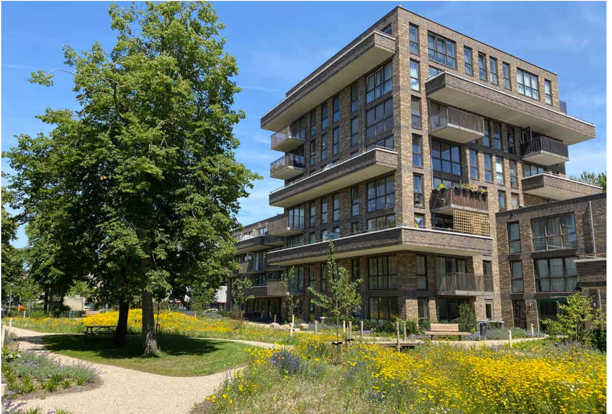
parktuinzijde met ontmoetingsplek onder de bestaande bomen