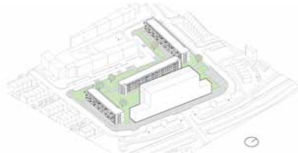
blok verdikken voor verdichting en voor een beter woning programma + maaiveld