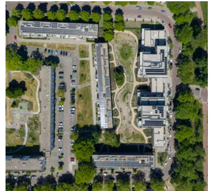
luchtfoto nieuwe situatie