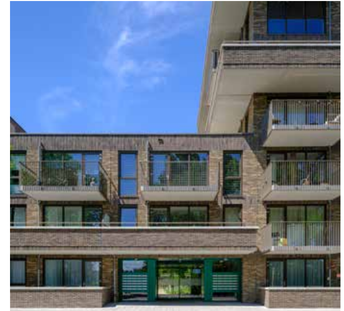
nieuwe hoofdentree met doorzicht naar de collectieve binnentuin

De herontwikkeling van Blok 4 in Parkwijk vertrekt nadrukkelijk vanuit de bestaande stedenbouwkundige logica van de naoorlogse strokenverkeveling. Deze open, groene structuur – met haar heldere oriëntatie, doorzichten en collectieve ruimte – vormt geen beperking, maar juist de drager van het plan. De ambitie was scherp: verdichten zonder de ruimtelijke kwaliteit van de strokenbouw aan te tasten.