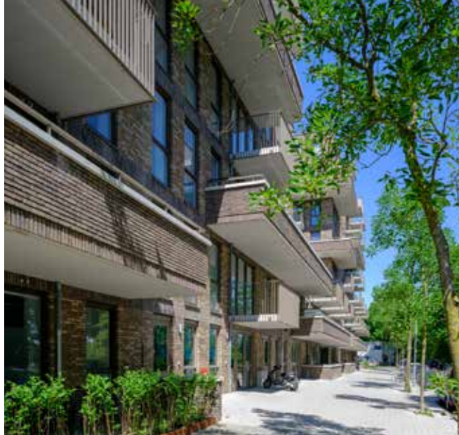
openbare ruimte met aangrenzende buitenruimtes

Awards nominatie Lieven de Key Penning 2024