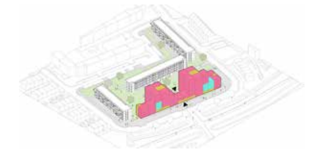
woningprogramma blok 4 - 84x 3-kamer appartementen + 16x 2-kamer appartementen

De Strokontoren positioneert zich daarmee als een voorbeeld van hoe naoorlogse wijken toekomstbestendig kunnen worden getransformeerd. Niet door radicale breuk, maar door gerichte verdichting, verfijning van de openbare ruimte en een herwaardering van bestaande stedenbouwkundige kwaliteiten. Het project onderstreept dat ook binnen de context van betaalbare woningbouw hoge ambities mogelijk én noodzakelijk zijn – juist hier komt de kwaliteit van de stad het meest tot uitdrukking.