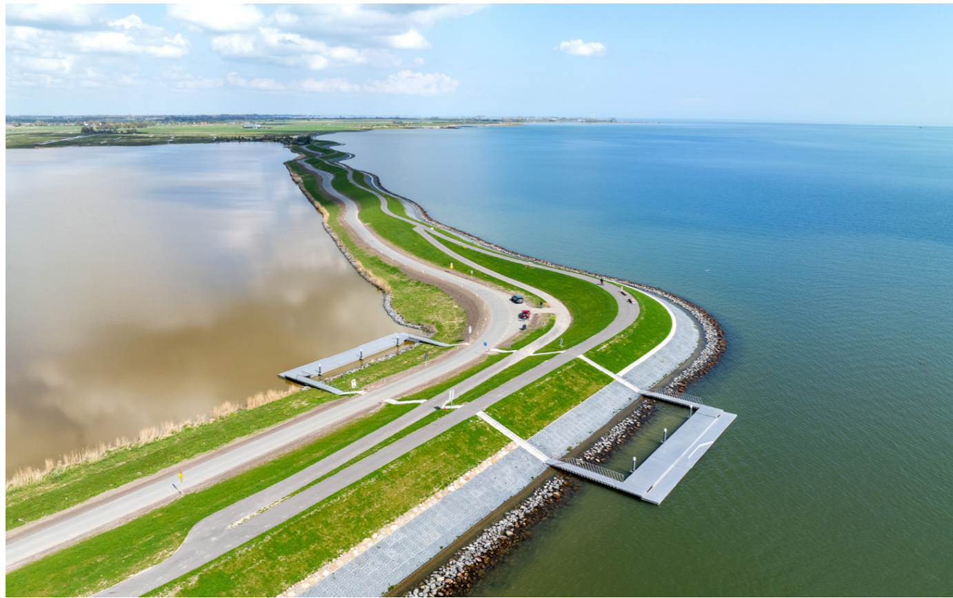
Vogelvlucht van dijkplaats Kinselmeer met recreatiesteiger en kano-oversteekplaats