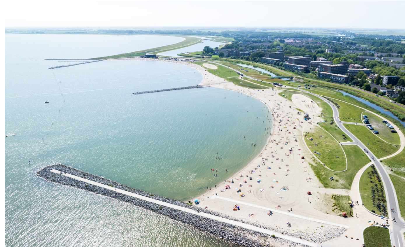
Vogelvlucht van Stadsstrand Hoorn