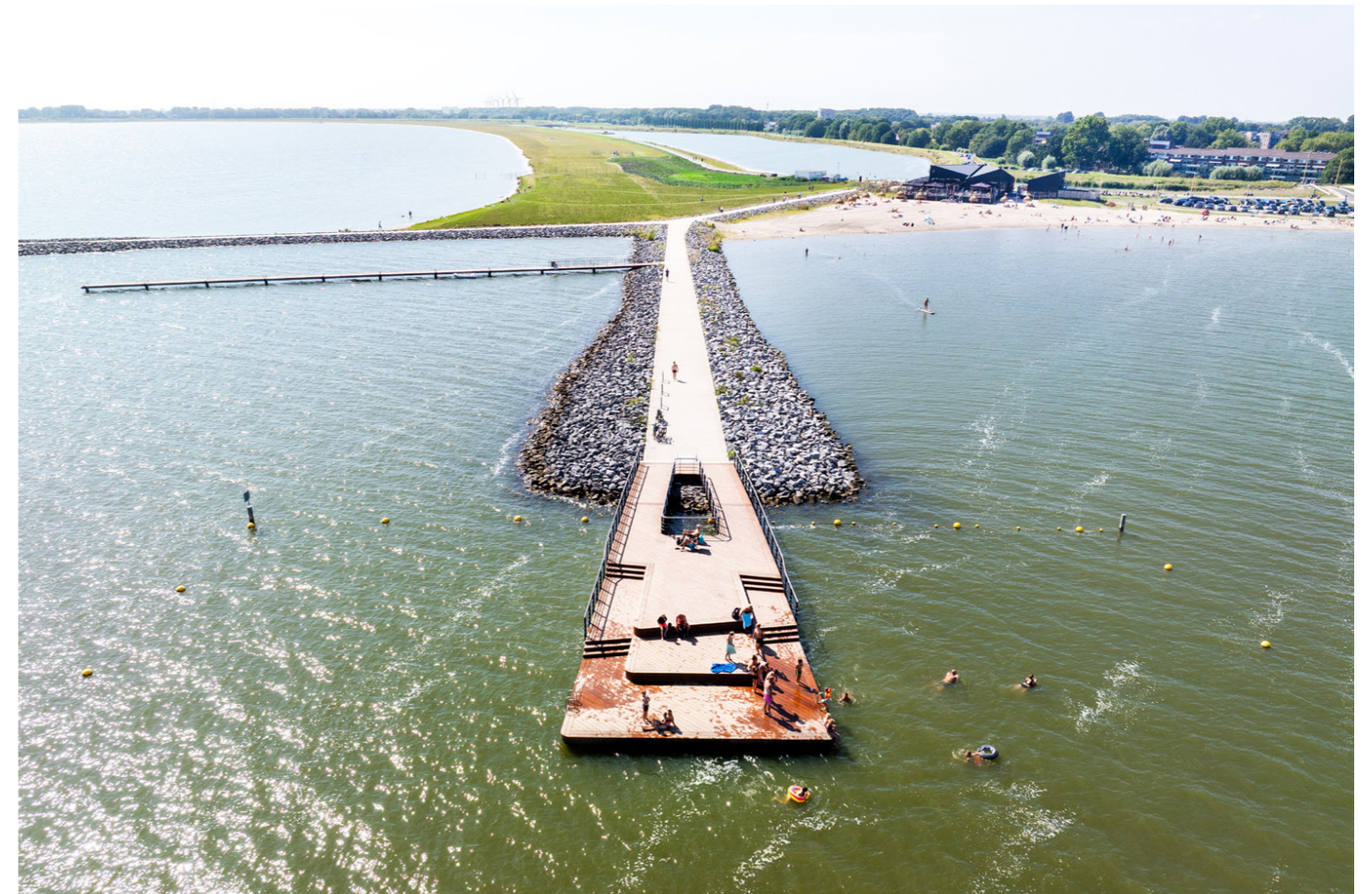
Foto van een recreatiesteiger op de kop van een strekdam bij Stadsstrand Hoorn

Het strand was direct na de opening een succes. Daarnaast is 3,5 kilometer oeverdijk ingericht als nieuw natuurgebied, met flauwe oevers en rustige waterzones waar vissen kunnen paaien en het ecosysteem