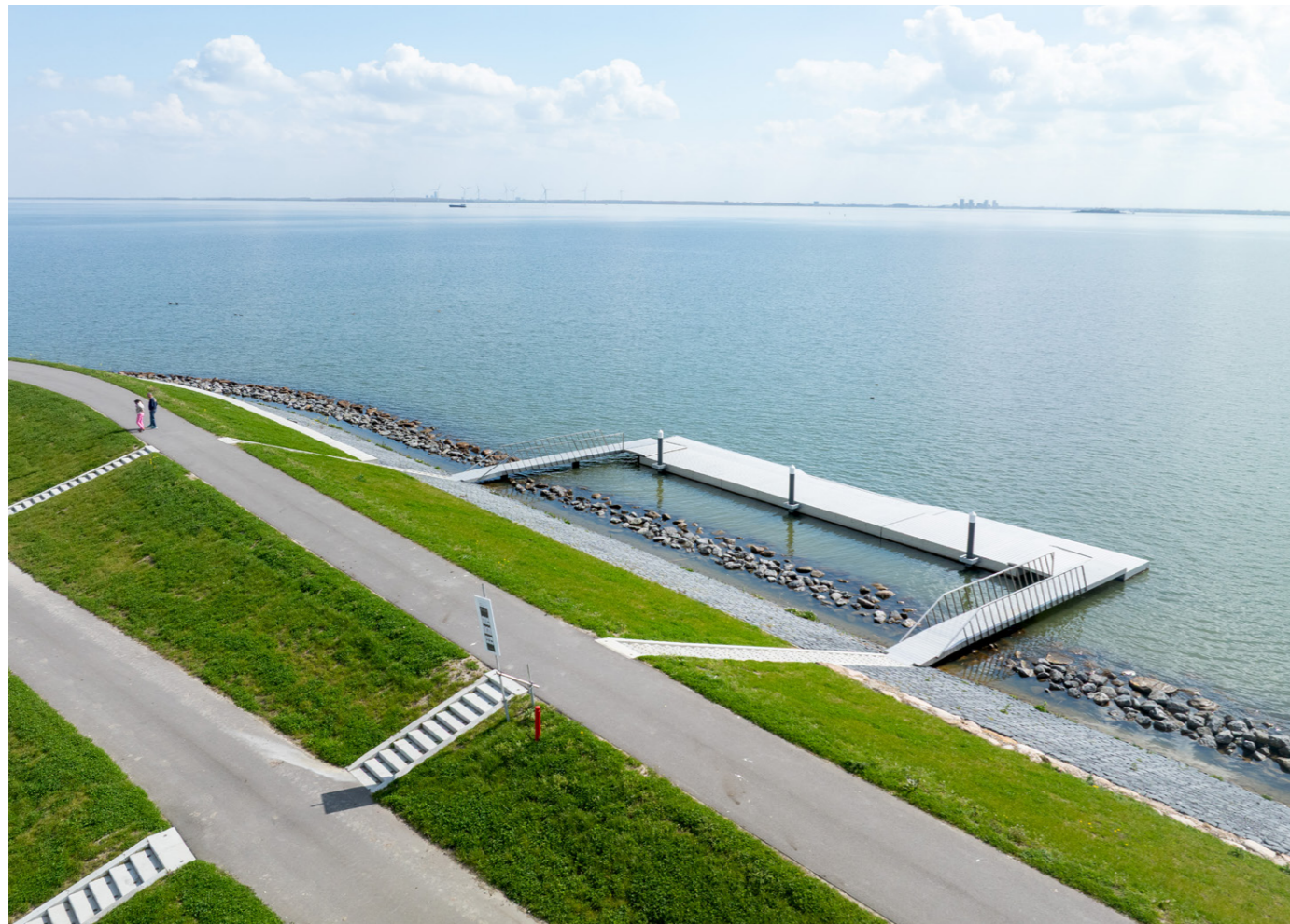
Vogelvlucht van dijkplaats Kinselmeer met recreatiesteiger en kano-oversteekplaats