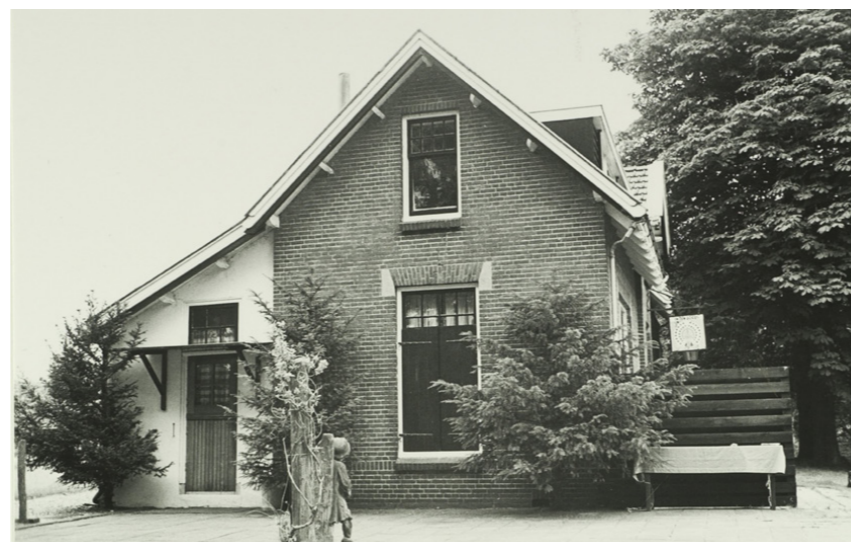
Dak voorzien van overstek met decoratieve balkkoppen. Amsterdamse schuiframen geflankeerd door luiken met zandlopermotief. Dakkapellen uit jaren '70