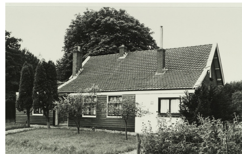
Aangekapt achterdeel met donker geverfde rabatdelen. Duidelijk onderscheid tussen representatieve zuid-/ westgevel en meer pragmatische noord-/ oostgevel