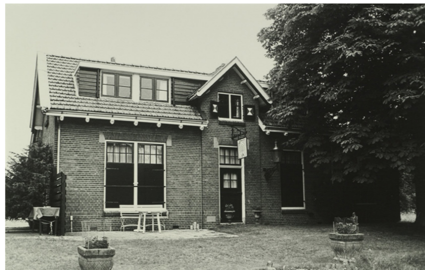
Voorgevel voorzien van metselwerkgevel in kruisverband (rij strekken afgewisseld met een rij koppen). Lateien uitgevoerd als gemetselde hanenkam

In de jaren twintig en 70 is het huis uitgebreid met toevoegingen die qua karakter en maatvoering niet aansloten bij de oorspronkelijke architectuur.