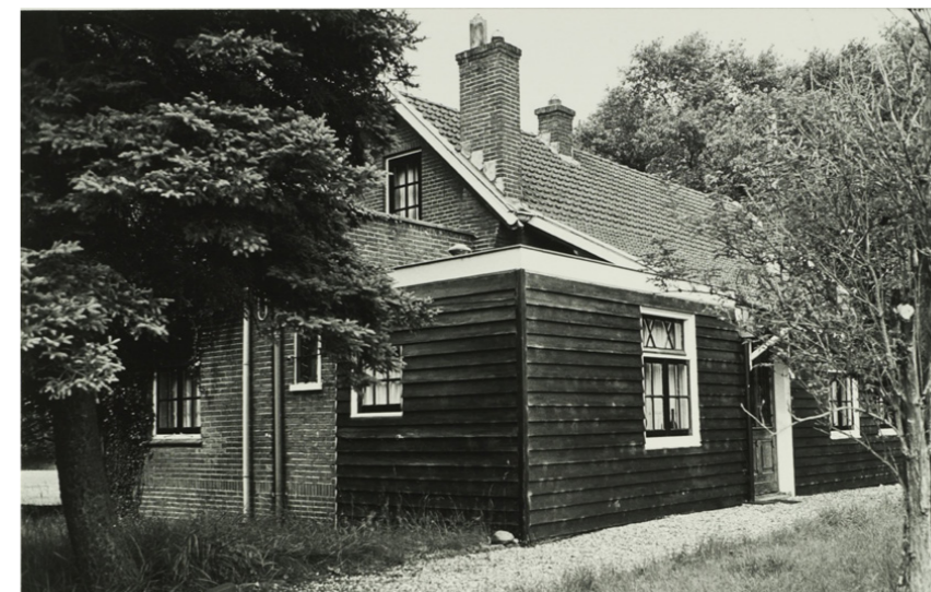
Latere uitbreidingen oostzijde, variërend in hoogte. Minder rijk karakter, halfsteens metselverband met standaard rollaag boven kozijnen