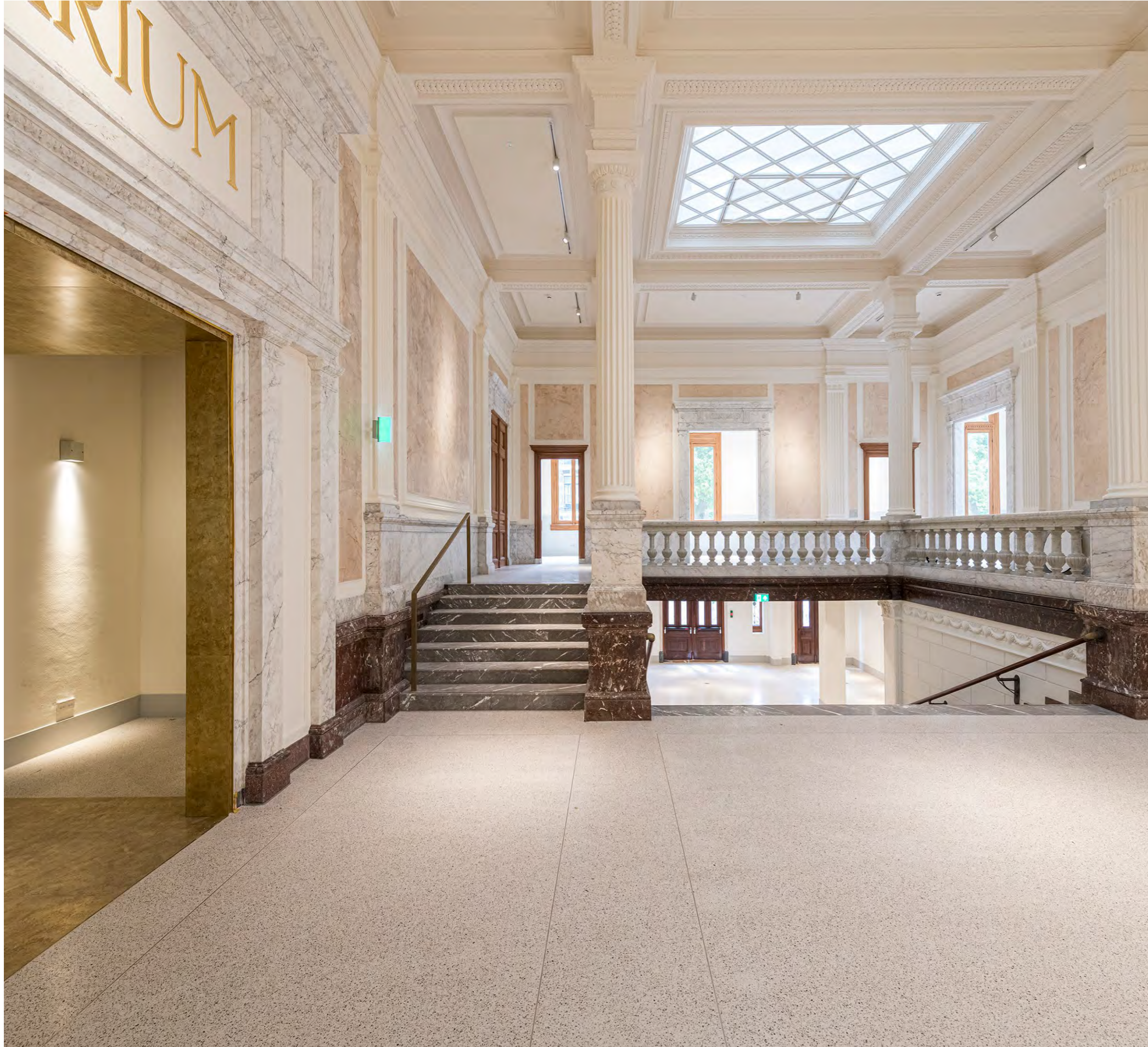
Klassieke hal, met aansluiting op de Plantage Middenlaan