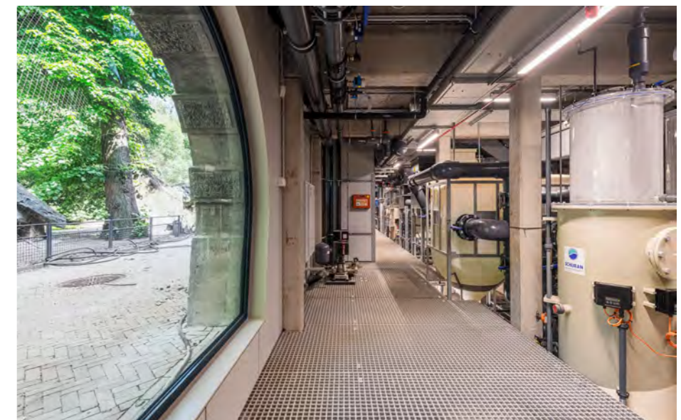
Technische filterruimte aan parkzijde