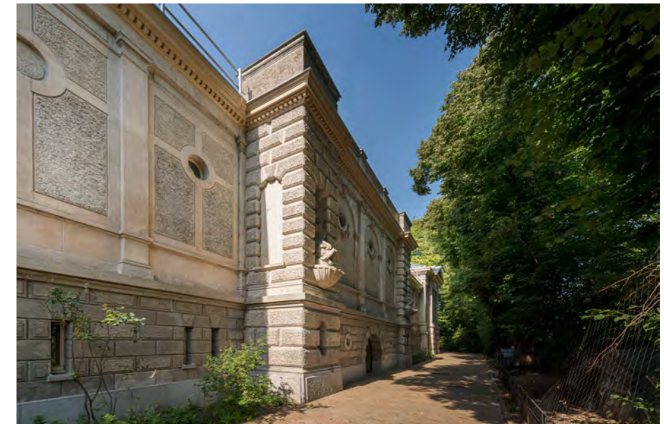
Nieuwe aansluiting van het Artis-park op het gebouw.