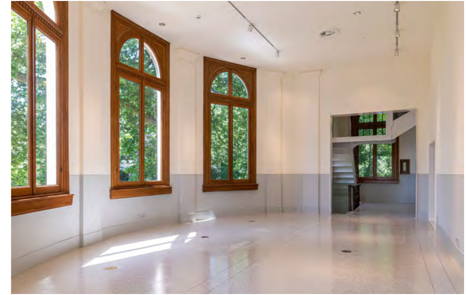
Museumzaal grenzend aan klassiek trappenhuis en Artis-parkzijde bezoekersentree.