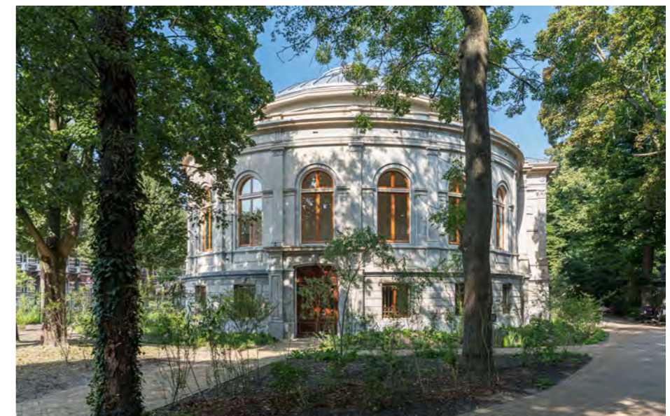
Kopgevelzijde Rotonda, toekomstig openbaar publieks Salmplein