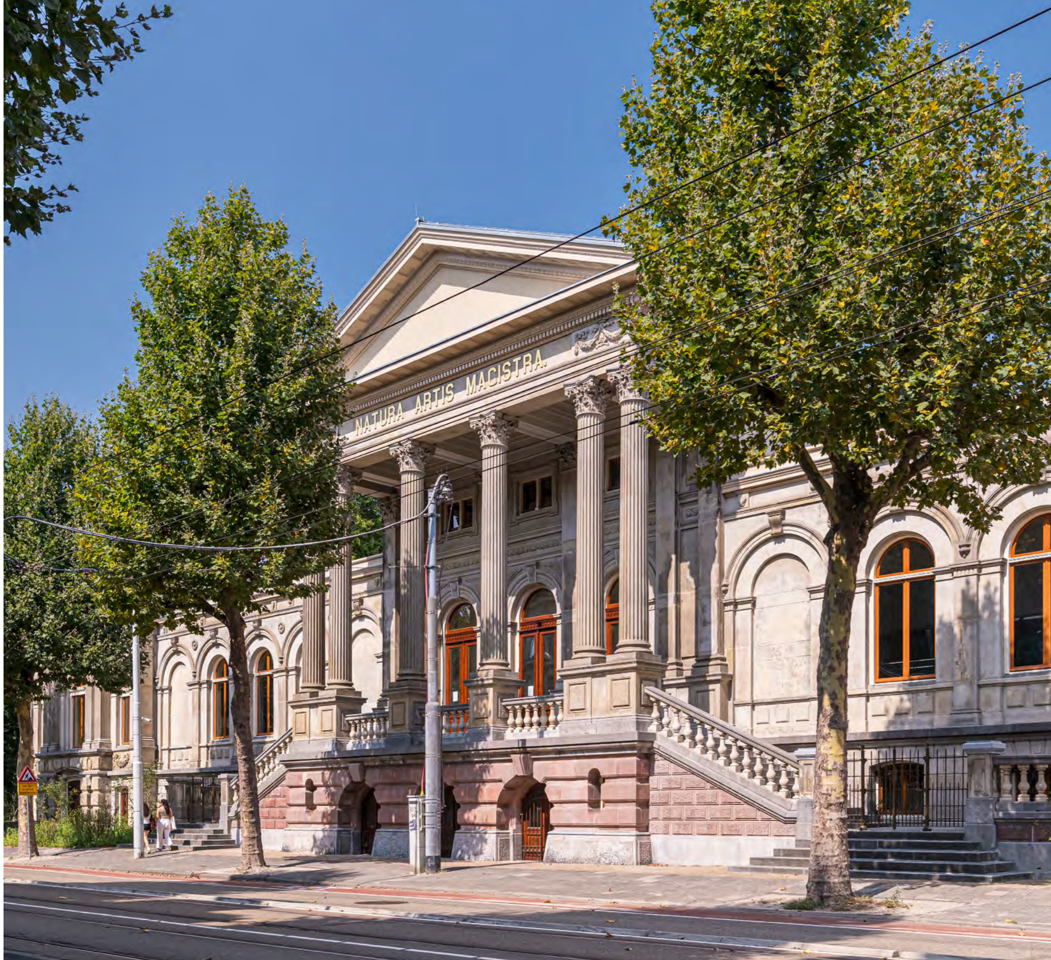
Straatgevel, Plantage middenlaan