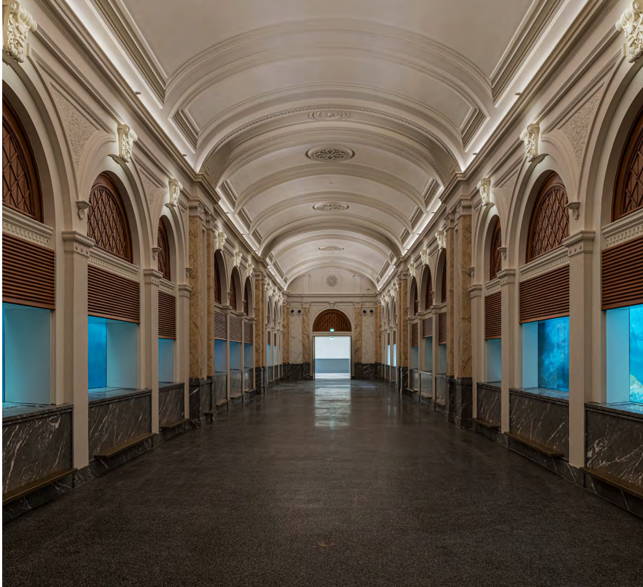
Grote aquariumzaal met vista naar de kleine zaal, met zichtrelatie op het Artis-park.