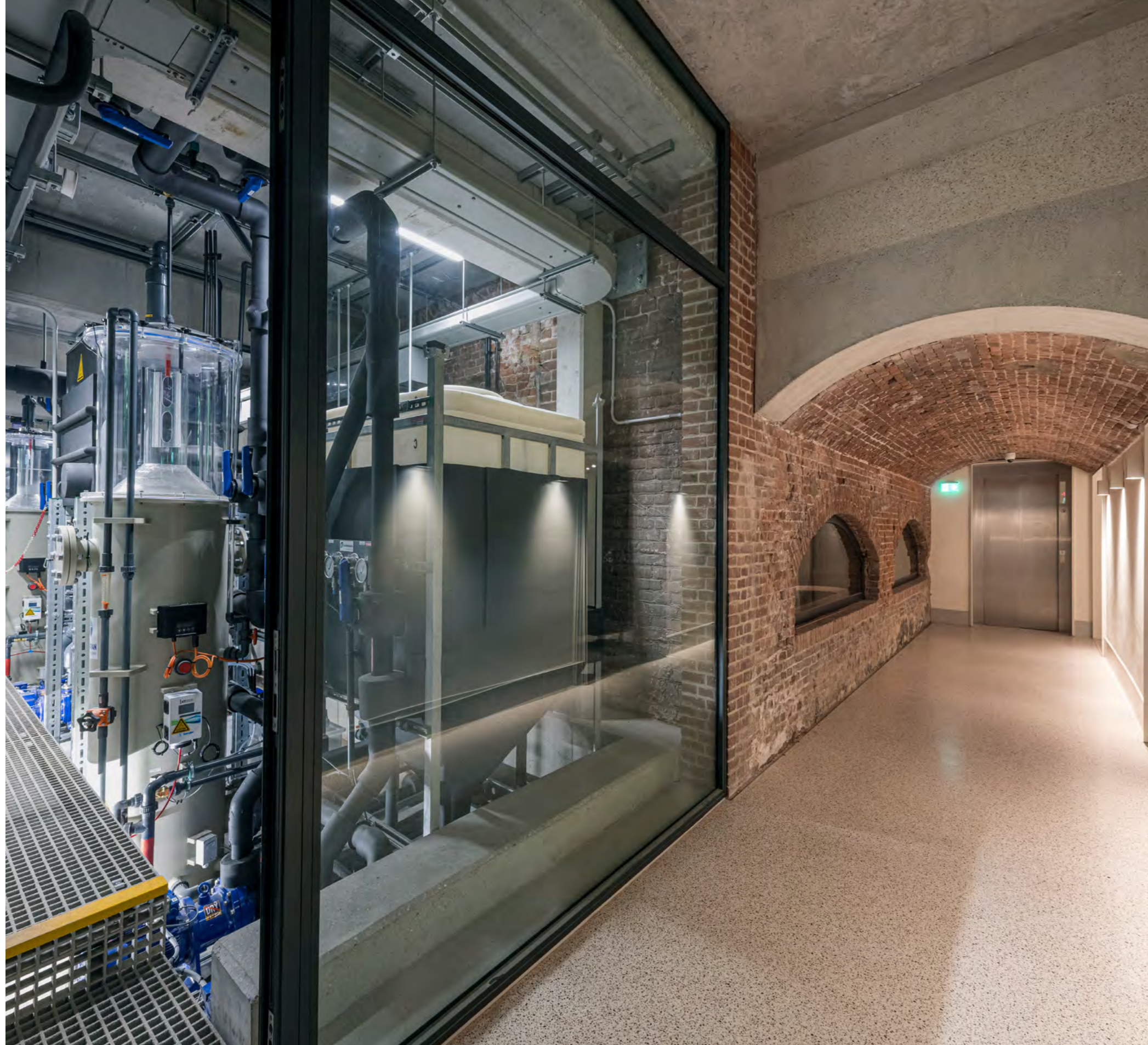
Technische filterruimte in souterrain zichtbaar gemaakt vanuit publiekruimte