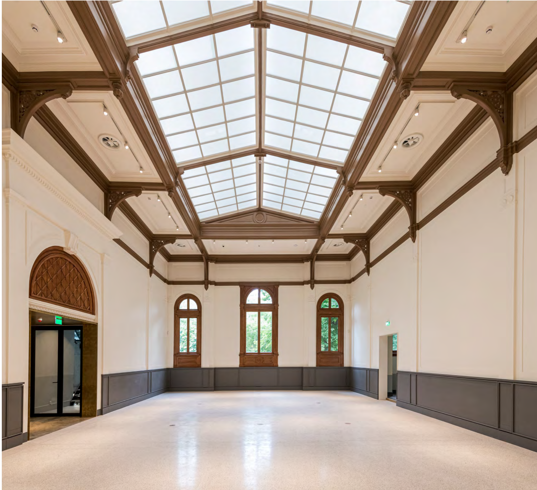
Kleine zaal voor bijeenkomsten, exposities en vrijstaande aquaria met zichtrelatie op het Artis-park.