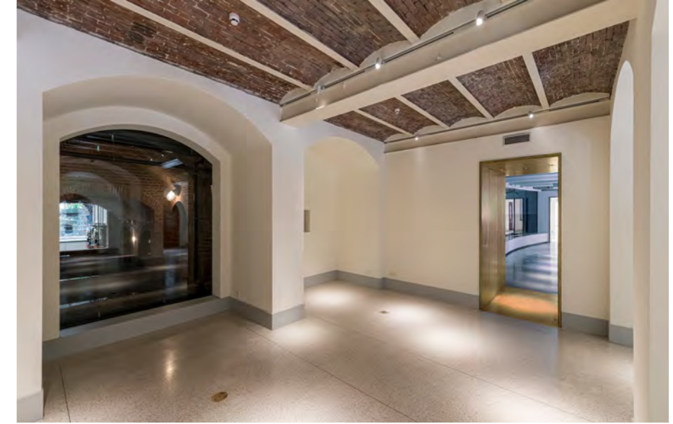
Begane grond met zichtas over de volledige breedte van het gebouw