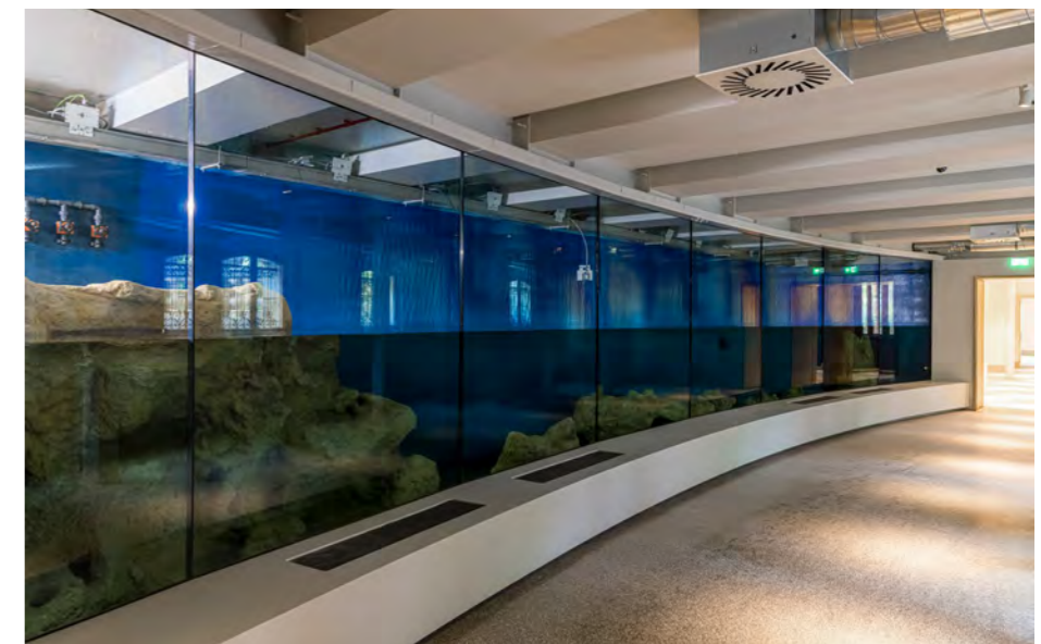
Aquariumzaal begane grond, grenzend aan de Plantage Middenlaan.