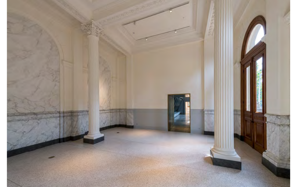
Vestibule, representatieve entree aan de Plantage Middenlaan. Met doorgang naar aquariumzaal.