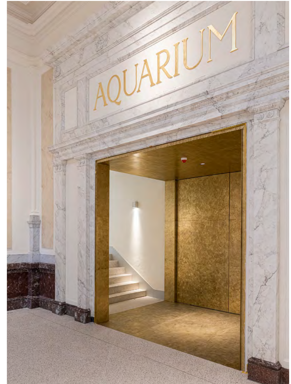
Entree grote aquarium zaal met trap naar zaal die aansluit op Artis-park.